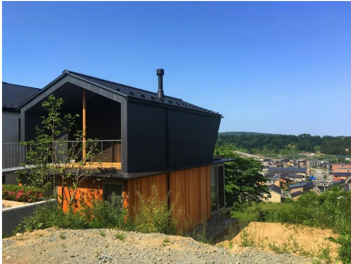
田上新町見晴らしの家【金沢市】(設計:谷重義行建築 像景、施工:けやき住建+ライフデザイン)