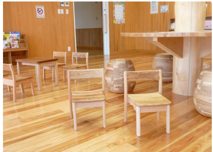
KIDSチェア(製造者:町八家具)

県産材利用の模範となる住宅や非住宅建築物のほか、優れた県産材使用製品等を紹介し普及啓発することを目的に、「いしかわの木づかい表彰」を実施します。