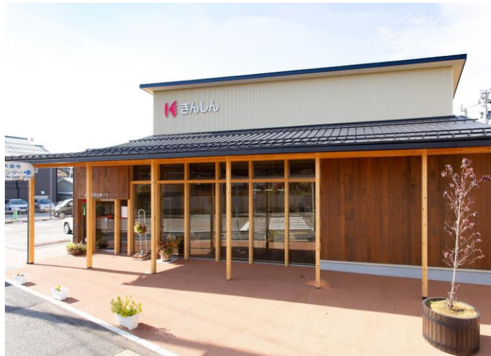
金沢信用金庫大聖寺支店【加賀市】(設計:高屋設計 環境デザイン、施工:小中出組)