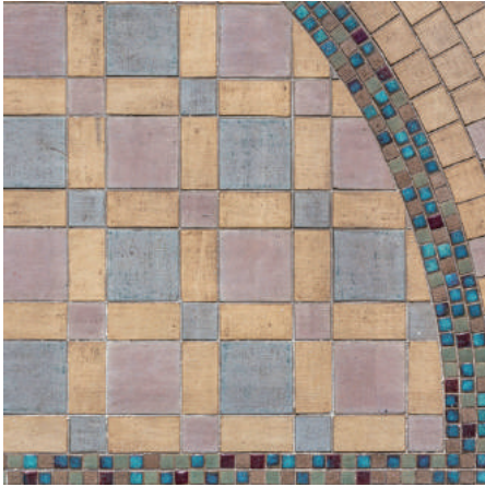
東京都庭園美術館(旧朝香宮邸)の 昭和初期のタイル [東京都港区]