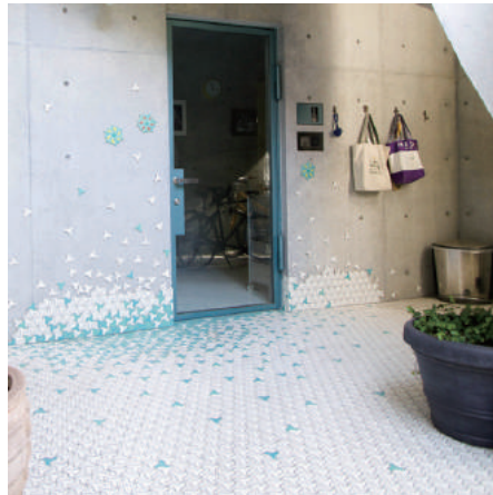
個人邸の入口に創作した タイルを使用 [東京都]