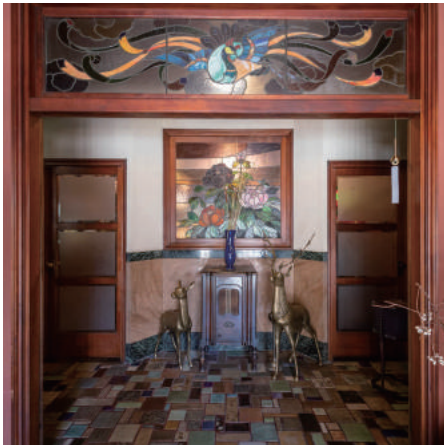
泰山タイルをつかった 「きんせ旅館」入口 [京都市下京区]