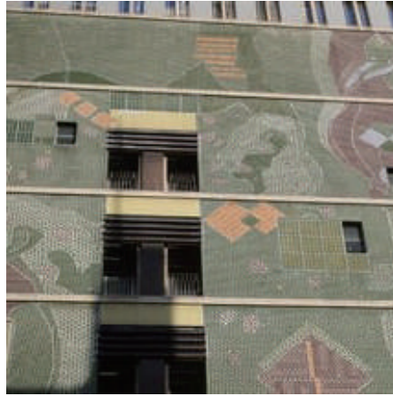
村野藤吾による丸栄百貨店の モザイク壁画 [名古屋市中区]