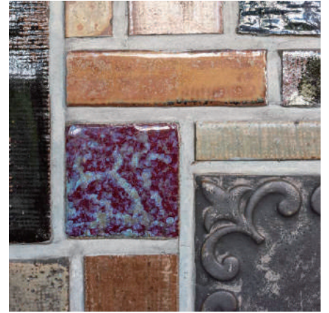
明治から大正にかけて生産された 京都の泰山タイル [京都市下京区]