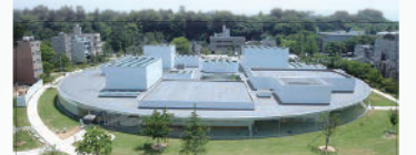
金沢21世紀美術館 設計:妹島和世+西沢立衛/SANAA