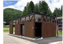
北五百川（きたいもがわ）公衆トイレ