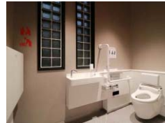
太宰府天満宮お石茶屋横トイレ