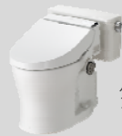
パブリックコンパクト便器 フラッシュタンク式