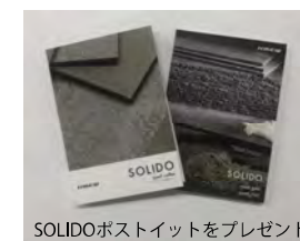
SOLIDOポストイットをプレゼント

本イベントは「Cisco Webex Events」を使ったウェブ配信となります。 お申し込み時に記載いただきましたメールアドレスへ視聴登録用のURLを 送付いたしますので、事前登録をお願いいたします。