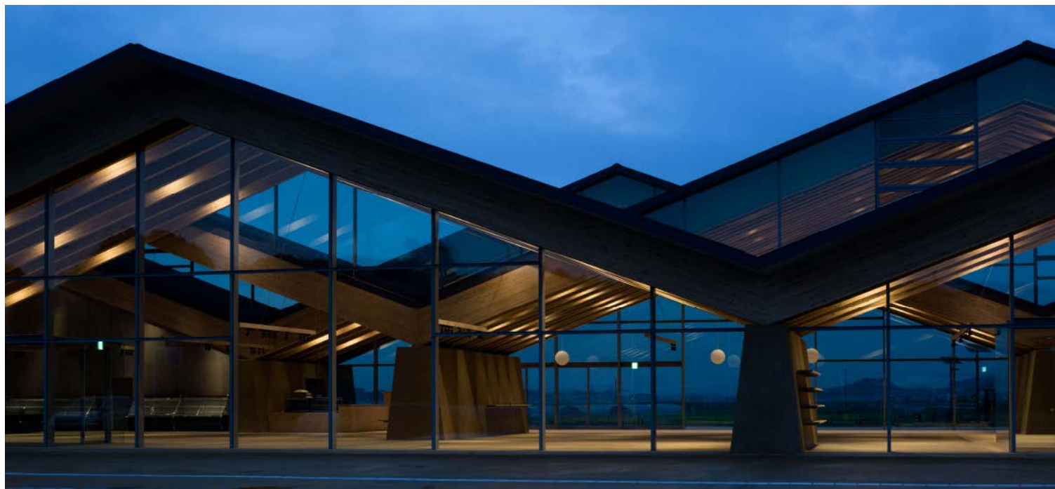
2017年度 JIA 日本建築大賞・優秀建築賞：日本建築大賞「道の駅ましこ」 設計 / MOUNT FUJI ARCHITECTS STUDIO