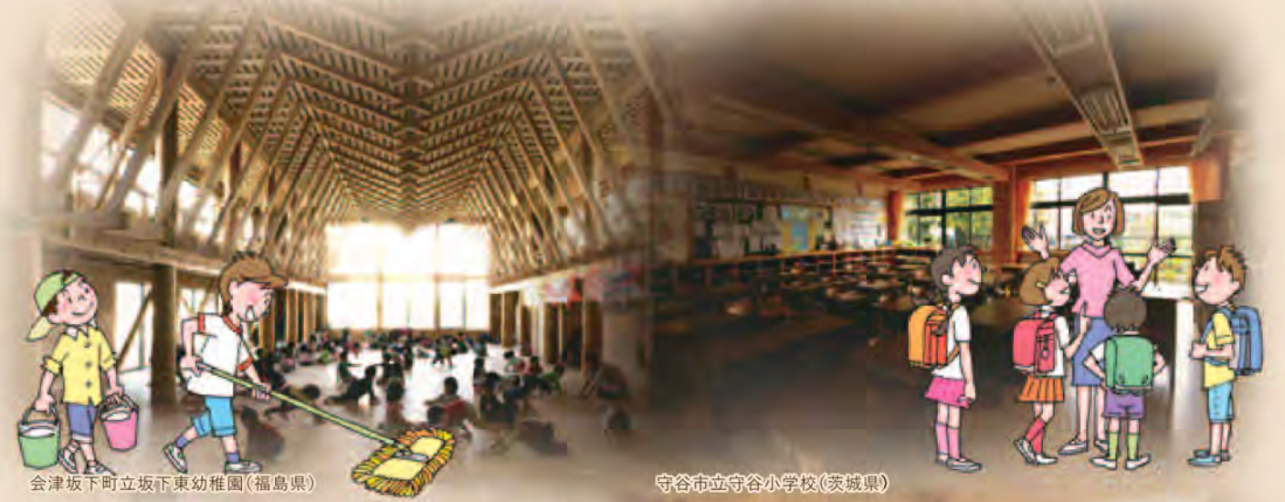
会津坂下町立坂下東幼稚園(福島県)