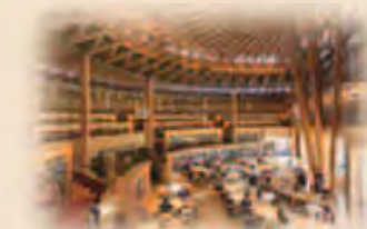
国際教養大学中嶋記念図書館(秋田県)