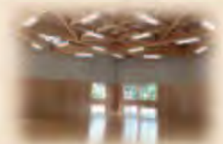
中津川市立加子母中学校 武道場(岐阜県)