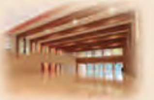
北広島町立豊平小学校多目的ホール(広島県)