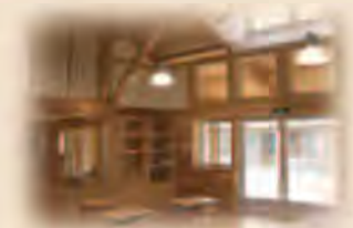
福井県立南越特別支援学校(福井県)