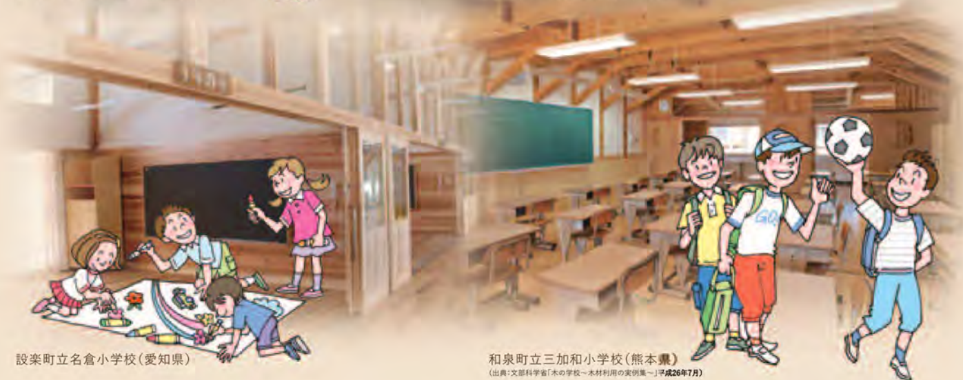
設楽町立名倉小学校(愛知県)