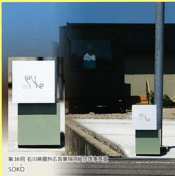
第38回 石川県屋外広告業協同組合理事長賞 ソコ SOKO

主催 いしかわ広告景観賞実行委員会(石川県、金沢市、石川県屋外広告業協同組合) 後援 石川県市長会、石川県町長会、石川県商工会議所連合会、石川県商工会連合会、石川県中小企業団体中央会、 (公社)石川県観光連盟、(公財)石川県デザインセンター、石川県ビジュアルデザイン協会、(一社)石川県建築士事務所協会、 (一社)日本屋外広告業団体連合会、石川県屋外広告士会