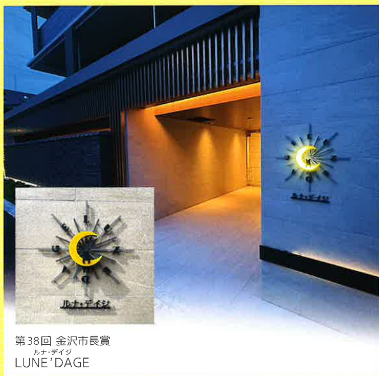
第38回 金沢市長賞 ルナ・デザイン LUNE'DAGE