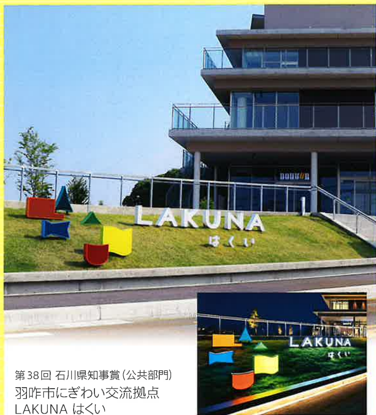
第38回 石川県知事賞(公共部門) 羽咋市にぎわい交流拠点 LAKUNA はくい

都市景観等の向上と屋外広告物への関心を高めることを目的に、優れた屋外広告物に対して広告景観賞を授与いたします。多くの方々のご応募を賜りますようお願いいたします。