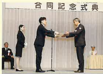
(右)同中央イベントの合同記念式典において国土交通大臣賞が授与されました。