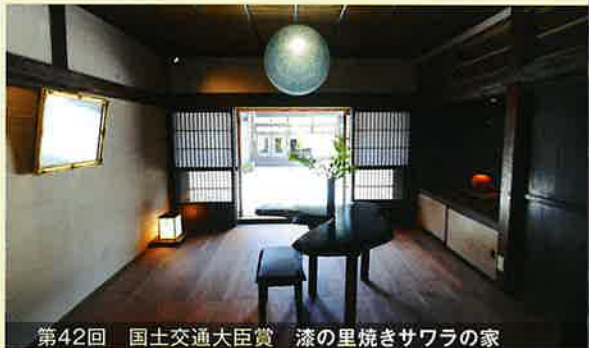
第42回 国土交通大臣賞 漆の里焼きサワラの家

国土交通大臣賞は 10月の住生活月間中央イベント において、国土交通大臣から表彰 授与されます