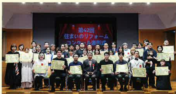
第42回住まいのリフォームコンクール入賞者の皆さん。表彰式、特別講演会/パネルディスカッションにて。