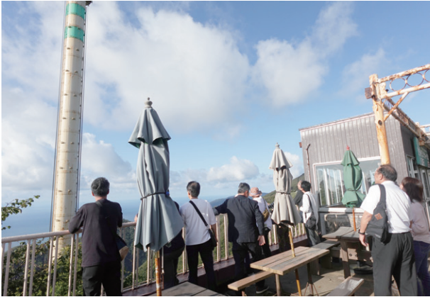
弥彦山ロープウェイ

視察に関しては、2日(木)の朝、金沢駅を出発し、バスで新潟県へ向かいました。最初に訪れたのは弥彦神社。荘厳で静謐な雰囲気にも包まれた境内は、自然と建築の調和を感じさせる空間でした。続いて弥彦山ロープウェイに乗り、山頂からの眺望を満喫。新潟平野と日本海を一望でき、地形と都市との関係を改めて実感しました。