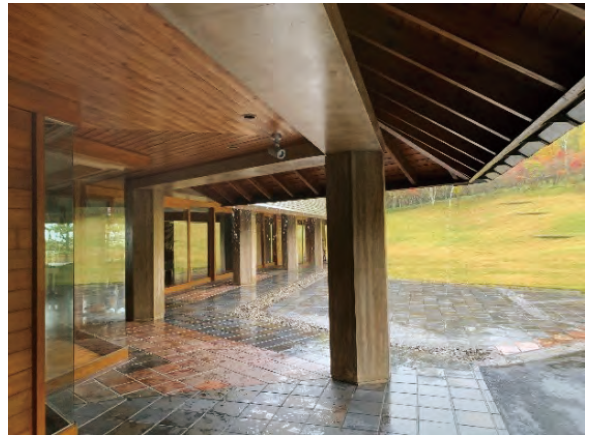
庇下の六角形列柱