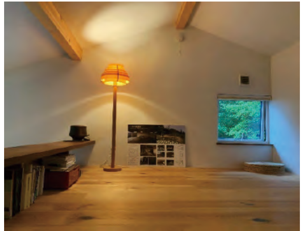
瀬戸漆喰による壁、天井仕上げ