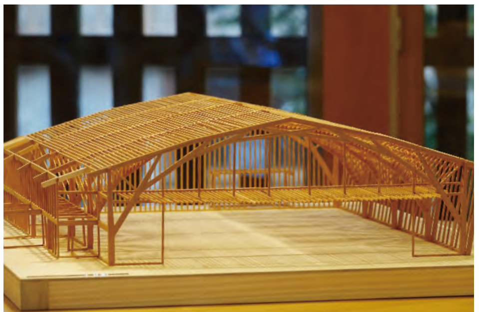
事務室兼展示室にある模型