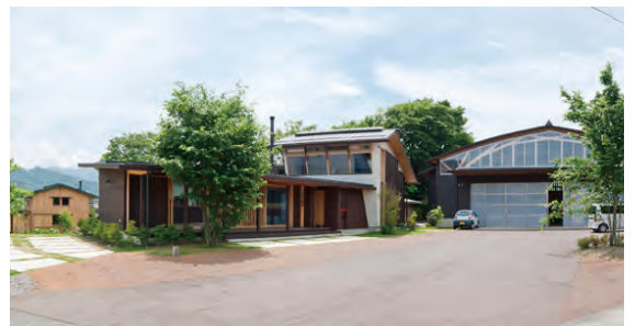
左が事務室 右が工場

構造計算は許容応力度計算しているが、延床面積499㎡と500㎡未満のため4号物件に該当し壁量計算で申請したもので、許容応力度計算で提出すると適判が必要になり、実現できなかったとのこと。