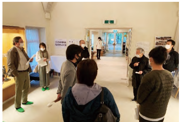
展示室の奥に見るエントランス