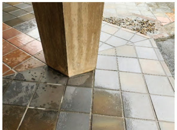
外部床のタイル割