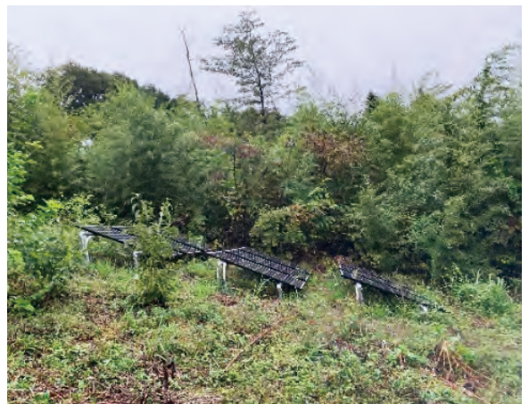
建物正面に設置した太陽光パネル