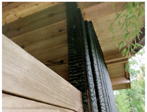
外壁の焼杉は部分的に表面を削って使用