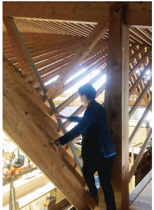
キャットウォーク