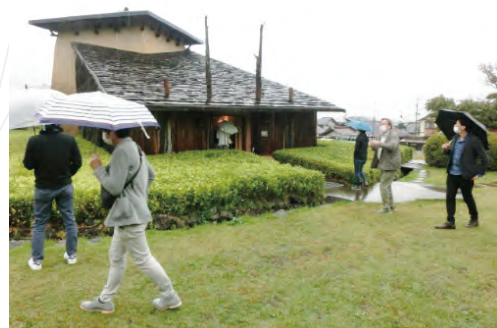
入口と四本の柱(イチイの樹木)